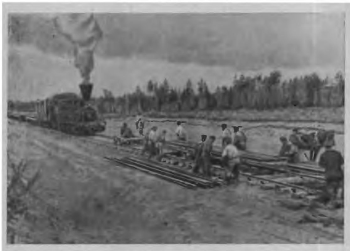
На постройке Сибирской железной дороги. (Великий путь, вып. I. Красноярск, 1899).

Проблема обеспечения строительства Сибирской магистрали рабочей силой была наиболее трудной, и решалась она типичным для капитализма путем: безработица, нужда, аграрное перенаселение в Европейской России создавали постоянную резервную армию труда, за счет которой и шло непрерывное пополнение рабочей силы на строительстве дороги.