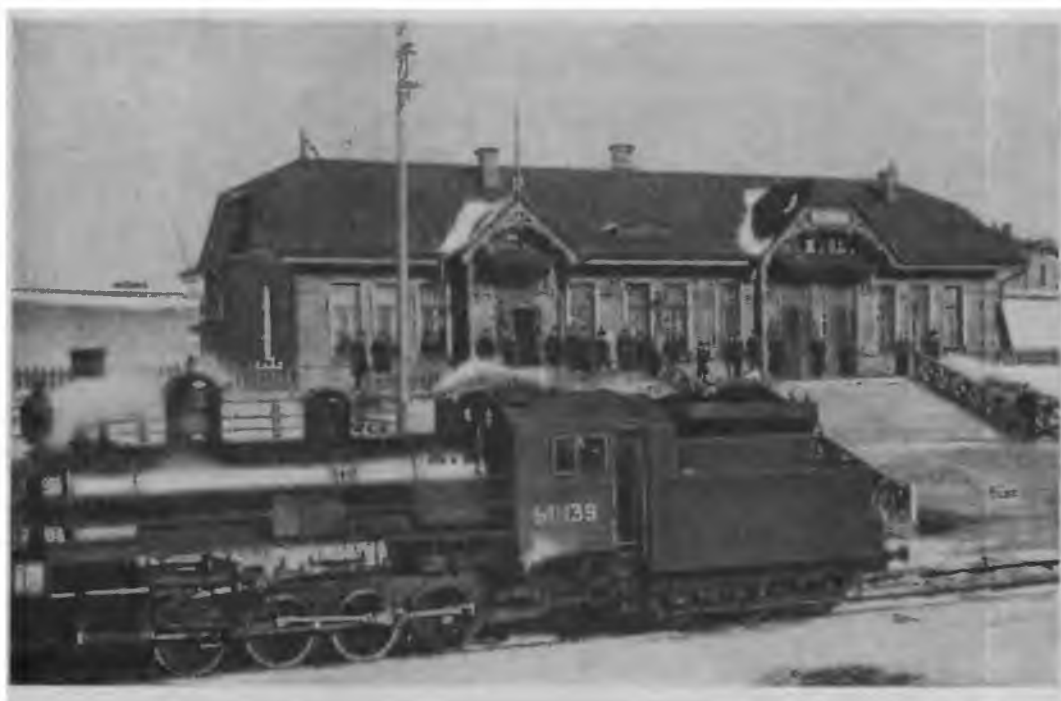
Вокзал в Новониколаевске. Начало XX в.

Кроме указанных выше английских предприятий в горном деле Сибири, многие иностранцы получили право на промышленную разработку полезных ископаемых, большинство из них вело минимальную добычу, чтобы не потерять право на месторождение. Однако до 1907 г. иностранный капитал не играл сколько-нибудь заметной роли в горном деле Сибири. Созданные в этот период иностранные горнопромышленные компании действовали, как правило, на основе уставов своей страны и лишь на определенных условиях допускались к операциям в России. Они представляли чужеродный элемент в экономическом организме края. Правле-