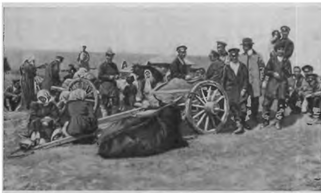
Якуты на ярмарке.

Монополии, закабаление путем ростовщического кредитования — таковы были «несложные начала», на которых основывалась торговля с народами Сибири. Пользуясь острой нуждой охотников, рыболовов, скотоводов, купцы давали в долг под высокие проценты товары и деньги. При неуплате в срок, преимущественно натурой, проценты повышались. В результате должники попадали в кабалу к купцам, были вынуждены за бесценок сдавать им пушнину, рыбу, скот и пр., становились по существу кабальными работниками кредиторов.