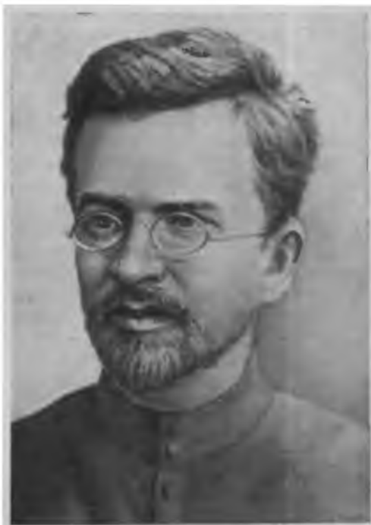
Н. Е. Федосеев — один из первых революционных марксистов в России.

Следующая группа марксистов, сосланная в Сибирь, принадлежала к числу руководителей первых социал-демократических организаций крупных промышленных центров России. Прежде всего это были члены Петербургской социал-демократической организации М. Бруснев и Л. Красин;