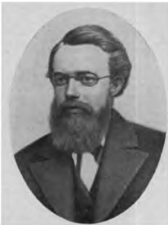
Исследователь Сибири И. Д. Черский.

Б. И. Дыбовский, так же как Чекановский и Черский, был политическим ссыльным, участником польского восстания 1863 г. Сосланный в Сибирь, он полюбил этот край, внес значительный вклад в дело его изучения и продолжал интересоваться Сибирью до конца своей жизни. Научное познание Сибири Дыбовский начал (совместно с В. Годлевским) в 1869 г. с изучения фауны, особенно микрофауны Байкала, а также наземной фауны его юго-западного побережья. За эти работы, внесшие много нового в представление о зоографии и биологии Восточной Сибири, Дыбовский и Годлевский были награждены золотыми медалями Географического общества. 1871—1875 гг. Дыбовский посвятил зоологическим исследованиям бассейна Амура, а в 1876 г. вновь возвратился на Байкал,