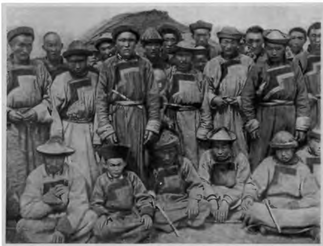
Группа рабочих бурят на постройке Забайкальской железной дороги. (Альбом Забайкальской железной дороги. Фотографии А. К. Кузнецова. Чита, 1901).

Непроходимая тайга, горы, болота, трескучие морозы зимой, зной и гнус летом превращали процесс труда в каждодневную и изнурительную