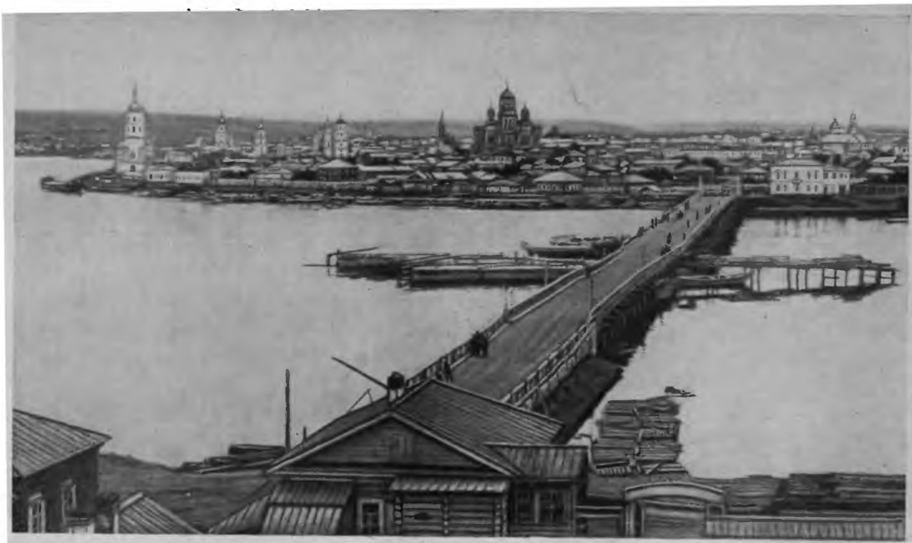
Иркутск. Начало XX в. (П. Головачев. Сибирь, М., 1902).