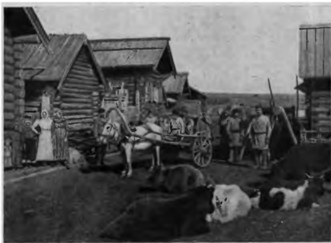
Улица в старожильческой деревне Чамы Иркутской губернии. (Азиатская Россия, т. 1. СПб., 1914).

Наличие в Сибири большой прослойки беспосевных и малопосевных хозяйств, безлошадных и однолошадных дворов показывает, что здесь не было общей высокой зажиточности крестьянства. Сравнительно большая обеспеченность сибирского крестьянства возникла за счет зажиточности кулацкой верхушки и дальнейшего разорения бедняцкой группы. Сибирское кулачество было более мощным, чем кулачество в центре страны. Так, в 1912 г. в Сибири было 50% хозяйств, имевших 4 и более лошадей, а в европейской части страны — только 10%. В Сибири было 5% хозяйств, каждое из которых имело 10 и более лошадей. Это были крупно-