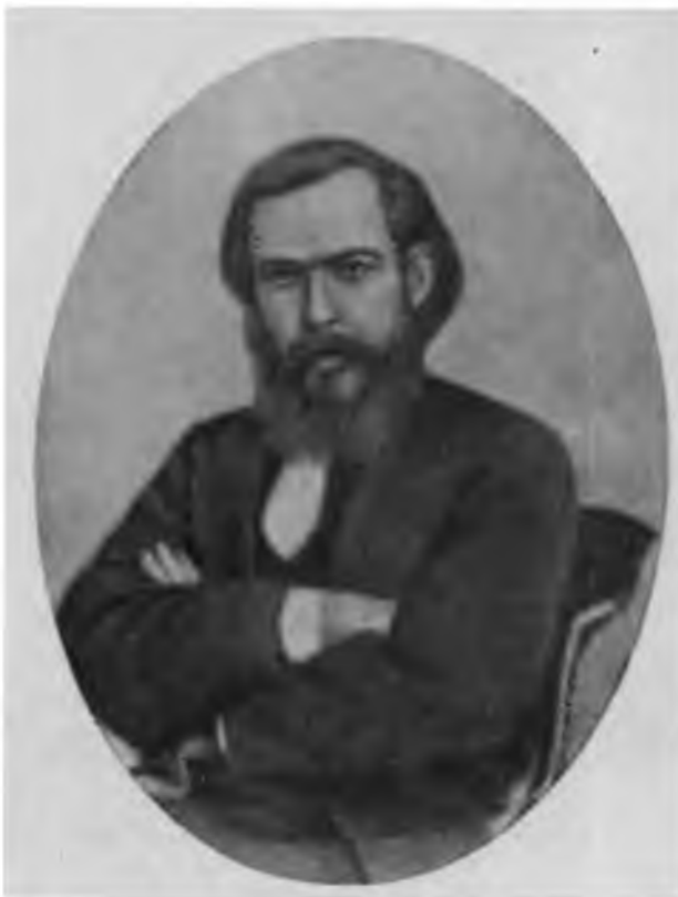
И. В. Федоров-Оммулевский — сибирский писатель второй половины XIX в.

В начале 70-х годов Н. И. Наумов приступил к новой в его творчестве теме — изображению жизни сибирских рабочих на золотых приисках. Он обратил внимание на их тяжелую долю и бесправное положение и, что