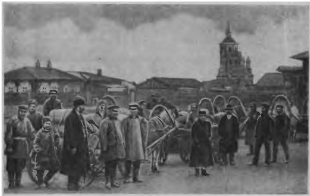
Якутск. Уличная сценка.

Распространенной формой эксплуатации у алтайцев и других скотоводов была отдача скота на выпас за приплод и отработки. Бедняк, получивший корову, был обязан за пользование молоком кормить ее, сохранить приплод и возвратить его баю. Кроме того, он должен был за