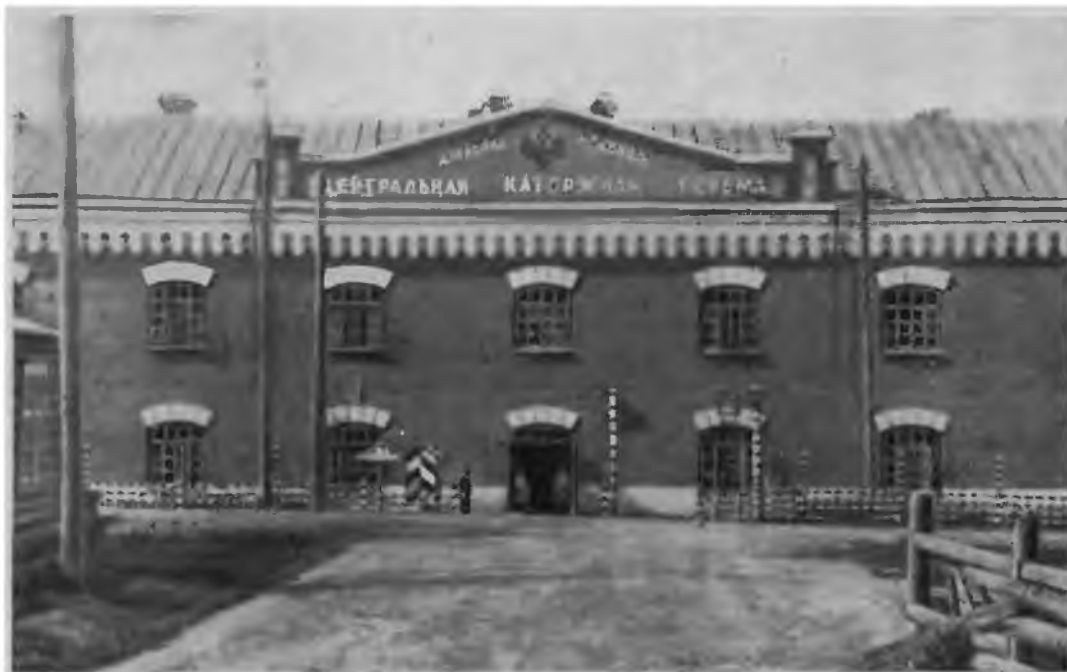
Александровский централ.

Ф. М. Достоевский назвал каторжную тюрьму «мертвым домом», П. Ф. Якубович-Мельшин — «миром отверженных». Оба они сами испытывали пребывание на каторге. Она набрасывала мрачную тень на «край изгнания». По этому поводу С. М. Степняк-Кравчинский писал: «Сибирь! При этом слове холодная дрожь пробирает вас до костей и, когда мы думаем о несчастных ссыльных, затерянных в ледяной пустыне и осужден-