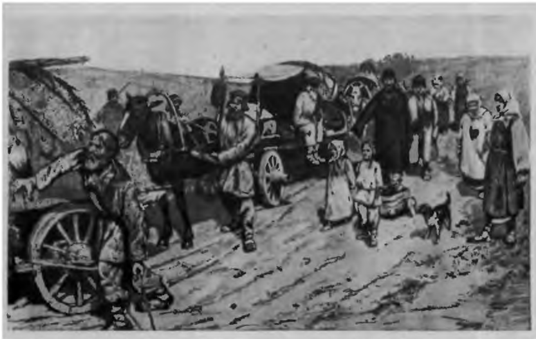
Переселенцы. Литография В. И. Иванова, 1885.

По социальному составу большинство переселенцев относилось к середнякам. У себя на родине они стояли на грани перехода в группу бедноты,