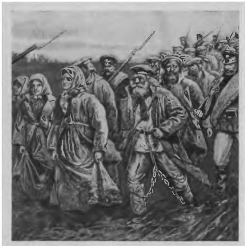
В дороге. На каторгу. («Живописная Россия», т. XII, ч. I, СПб., 1895).

В дореформенные времена осужденных на каторгу отправляли в Сибирь непосредственно для работ на казенных и кабинетских заводах и