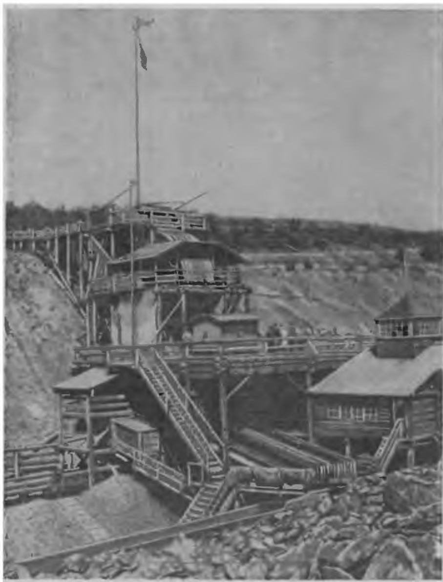
Машина для промывки золота. (П. Головачев. Сибирь. М., 1902).

Сибирское золото составляло основу золотого запаса России. Из 2207 пуд. золота, добытого в стране в 1882 г., на долю Сибири при-