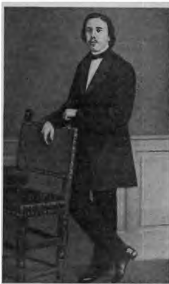
Н. А. Серно-Соловьевич — русский революционер-демократ. (Русско-польские революционные связи. Материалы и документы, т. II. М., 1963, стр. 557).

Из вилюйского заточения Чернышевский был освобожден только в августе 1883 г. 24 августа он выехал из Вилюйска в сопровождении жандармов. Его везли секретным порядком, стремясь изолировать от общения даже с близкими знакомыми.